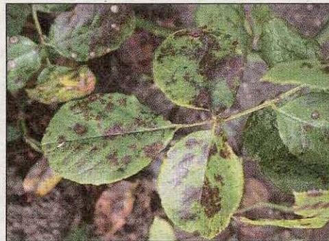
Sternrußtau an einer Rose.

Neben befallenen Früchten kann auch befallenes Laub zur Überwinterung dienen. Wie bereits erwähnt, überwintert der Erreger des Kirschenschorfes auch auf befallenen Blättern. Dies trifft ebenfalls auf den Apfelschorf Venturia inaequalis zu, die wirtschaftlich bedeutendste Pilzkrankheit an Äpfeln. Auf dem Falllaub entwickelt der Pilz Fruchtkörper, in denen sich die Pilzsporen entwickeln, die dann im Frühjahr bei kräftigen Regenfällen ausgeschleudert werden