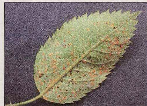
Rosenrost (Sporenlager) auf der Blattunterseite eines Rosenblattes.

Der Amerikanische Stachelbeermehltau ( Sphaeroteca mors-uvae ) ist die bedeutendste Krankheit an Stachelbeeren. Triebspitzen und junge Blätter sind von einem weißen, mehligem Überzug bedeckt. Dies führt zu einer Stauchung der