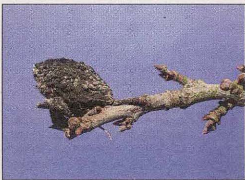
Fruchtmumie an Pflaume mit Moniliabefall.

Die Blütenmonilia, Spitzendürre oder Monilia laxa , tritt vor allem an Sauerkirschen, Aprikosen, aber auch bei Mandelbäumchen auf. Bei nasser Witterung werden die Pilzsporen verbreitet und infizieren die Blüten. Der Pilz breitet sich dann weiter bis in die Zweige aus. Befallene Pflanzenteile trocknen aus, es kommt zur Spitzendürre. Die Überwinterung erfolgt in grünligen Sporenlagern auf den Fruchtmumien, aber auch auf eingetrockneten Trieben und Blüten des vorangegangenen Jahres.