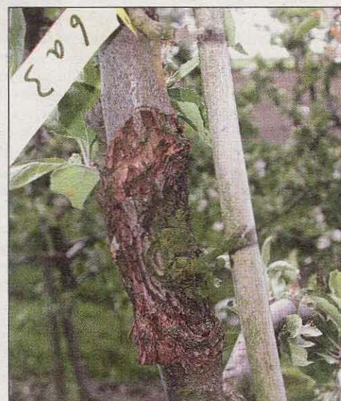
Obstbaumkrebs an einem Apfelbaum.

Ähnliches gilt für den Apfelmehltau ( Podosphaera leucotricha ), der ebenfalls in infizierten Knospen überwintert. Der Pilz kann dann schon beim Knospenaufbruch im Frühjahr viele Sporen bilden und schnell die jungen Blätter und Blüten infizieren. Der Apfelmehltaupilz überzieht die Oberfläche befallener Blätter oder Triebspitzen mit einem mehligweißen Belag. Infizierte junge Blätter stehen steil aufwärts und vertrocknen nach und nach. Infektionen von Apfelfrüchten können zu netzförmigen