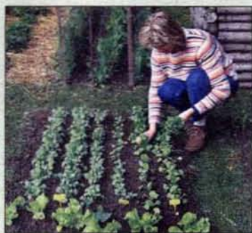
Feuchter Boden erleichtert das Ausdünnen bei Wurzelgemüse.

Falls bei der Aussaat von Möhren, Rettich, Radieschen oder anderen Kulturen versehentlich etwas zuviel Saatgut in die Rille geraten ist, sollte jetzt ausgedünnt werden. Noch sind die Pflanzen klein, für eine gute Entwicklung spielt ausreichend Platz jedoch eine wichtige Rolle. Besonders gut geht das Ausdünnen nach einem Regenguss von der Hand: der Boden ist schön feucht und die überzähligen Pflanzen lassen sich leicht herausziehen. Alternativ gießt man das Beet abends ausgiebig und lässt das Wasser über Nacht einziehen.