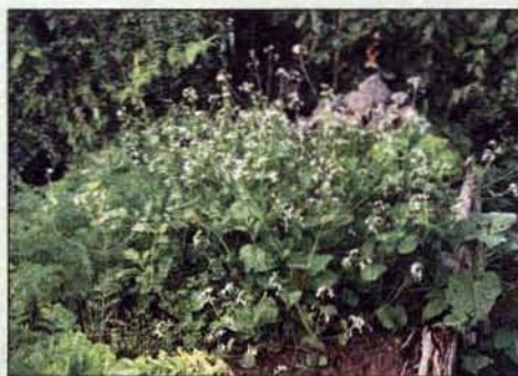
Geschossene Radieschen blühen bereits im Jahr der Aussaat.

Wenn's im Garten mal nicht so ganz klappt und der Salat in die Blüte geht, kann man das durchaus positiv sehen: solche Pflanzen bieten ein