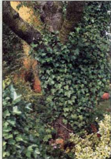
Efeu und Baumstämme – eine romantische Kombination für jeden Garten.

Efeu ist ein unermüdlicher Ranker und Kletterer. Diese Eigenschaften lassen sich elegant an bestimmten Stellen im Garten einsetzen. Von Efeu überzogene Baumstämme sehen romantisch aus und bieten auch im Winter dem Auge einen grünen Haltepunkt. Der Baum leidet nicht unter dem Bewuchs, soange der Efeu den Baumblättern nicht das Licht wegnimmt. Auf diese Weise können auch Baumstümpfe attraktiv gestaltet werden, so dass ein mühsames Ausgraben der Wurzel nicht nötig ist. Auch dunkle Ecken, die schnell kahl und unattraktiv wirken, sind mit immergrünem Efeu schnell und wirkungsvoll aufzupeppen.