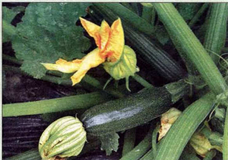
Zucchini schmecken am besten, wenn sie mit einer Länge von 15 bis 20 cm geerntet werden.